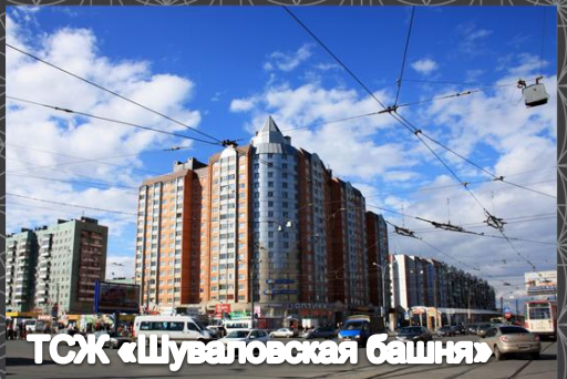
ТСЖ «Шуваловская башня»