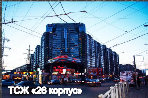
ТСЖ «26 корпус»