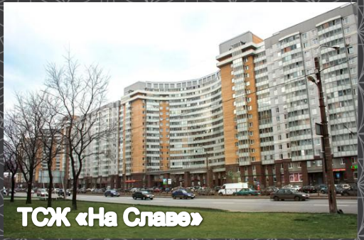
ТСЖ «На Славе»