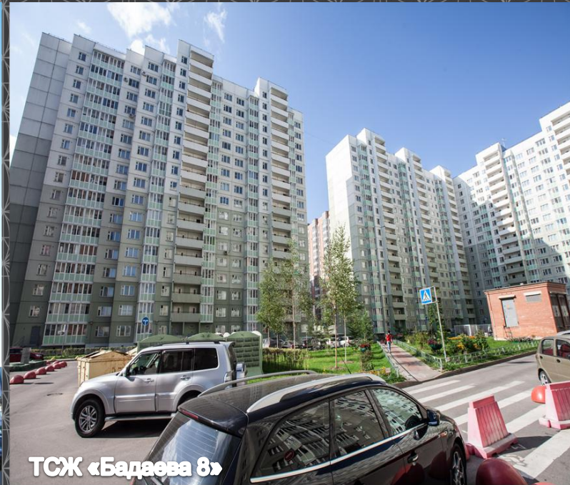
ТСЖ «Бадаева 8»