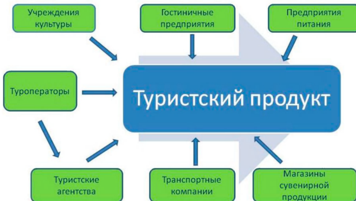
Схема добавочной стоимости туристского продукта

Географическое распределение туристских ресурсов туристского кластера обуславливает необходимость создания устойчивых схем взаимодействия конкретных компаний, дополняющих друг друга на отдельных участках работ, что позволит снизить конечные издержки.