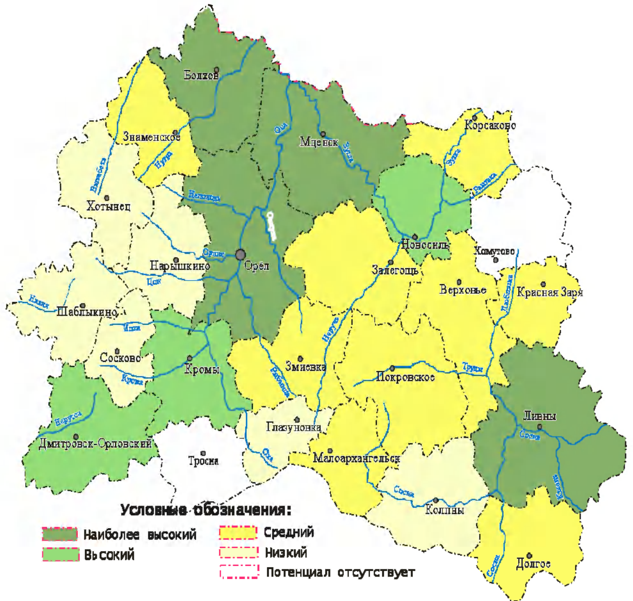
Рис.1. Культурно-исторический потенциал Орловской области

В качестве главного показателя количественной оценки объектов культурно-исторического наследия было выбрано количество памятников истории, археологии и искусства, стоящих в настоящее время на государственной охране.